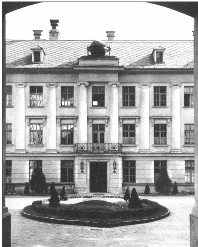
1. ábra A Rádióépület a Sándor utcai kapualjából nézve

királyi utca 25/a sz. alatti lakóépületet a külföldre irányuló, rövidhullámú (RH) adások szerkesztőségei számára. És még ugyanabban az évben elkezdődött egy új stúdióépület építése a Szentkirályi u. 25/b alatt. Ezt az új épületet stúdiócéllra tervezték, tehát nem meglévő épület átalakításáról van szó. Ez az első olyan része a Rádióknak, ahol a stúdiók eleve a decentralizált technikát figyelembevéve kerültek kialakításra, tehát minden stúdió mellé technikai helyiség épült, amelynek egy vagy két hangszigetelt áttekintő ablaka volt a stúdió felé. Itt épültek a stúdiók első ízben „ház a házban” elven, tehát kettős falakkal, padlózattal és mennyezettel, hogy az épületszerkezet által kívülről vagy belülről felvett úgynevezett testhangok és az egymás közötti áthallás ellen is szigetelve legyenek.