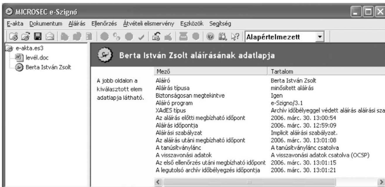
1. ábra Elektronikus aláírás ellenőrzése az e-Szignó program ingyenes változatával

A magyar közigazgatás a [4] szabvány által leírt XML elektronikus aláírás formátumot választotta. Ez egy nagyon jó választás – egy professzionális aláírás-formátum, amely alkalmas az aláírások letagadhatatlanságá-